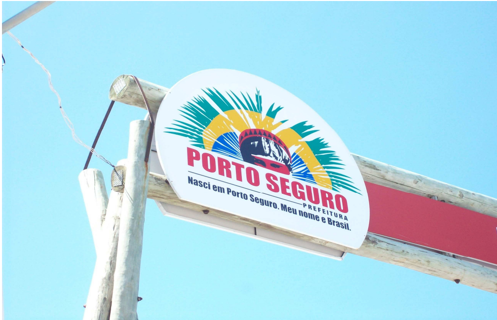
Figura 2 – Publicidade Turística da Prefeitura de Porto Seguro mediante utilização da imagem indígena.

X Seminário da Associação Nacional Pesquisa e Pós-Graduação em Turismo 9 a 11 de outubro de 2013 – Universidade de Caxias do Sul